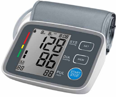
Kol Tipi Tansiyon Aleti U80 EH