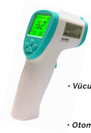
Life Net Temassız Ateş Ölçer WFR-107