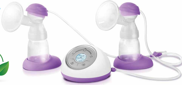
Elektrikli ve Şarjlı Çift Göğüs Pompası