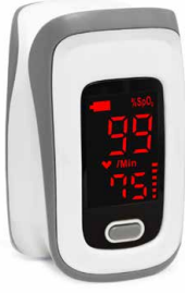
Pulse Oksimetre JPD-500E