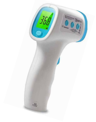
Life Net Temassız Ateş Ölçer FR-880