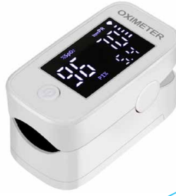
Pulse Oksimetre YM-103