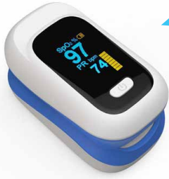
Pulse Oksimetre YK-80C