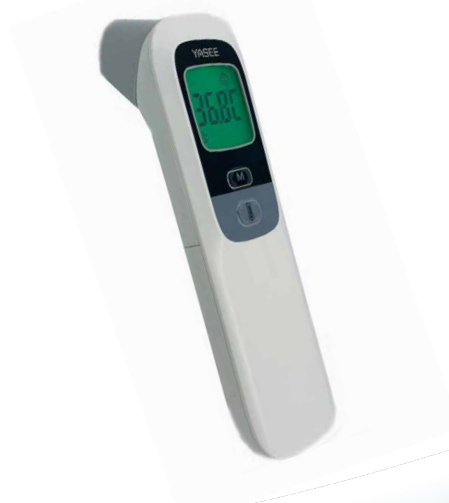
Temassız Ateş Ölçer FT-100B