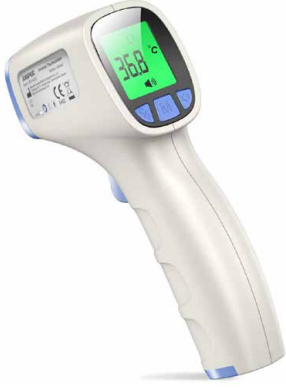
Life Net Temassız Ateş Ölçer FR-202