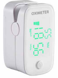
Pulse Oksimetre YM-102