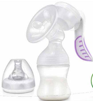
Manuel Göğüs Pompası